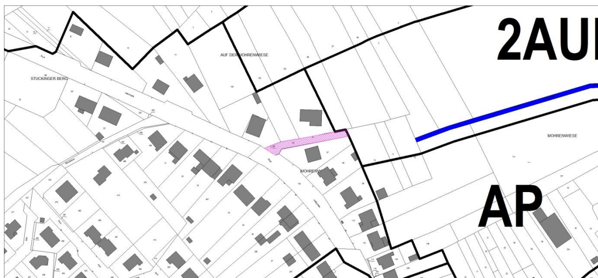
Emplacement réservé numéro 1