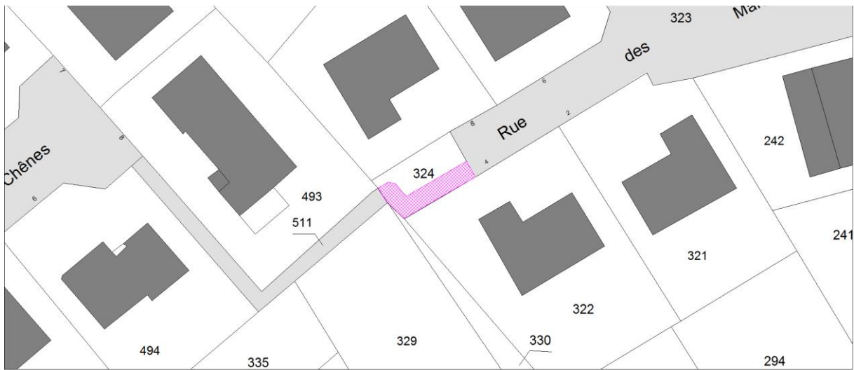
Emplacement réservé numéro 3